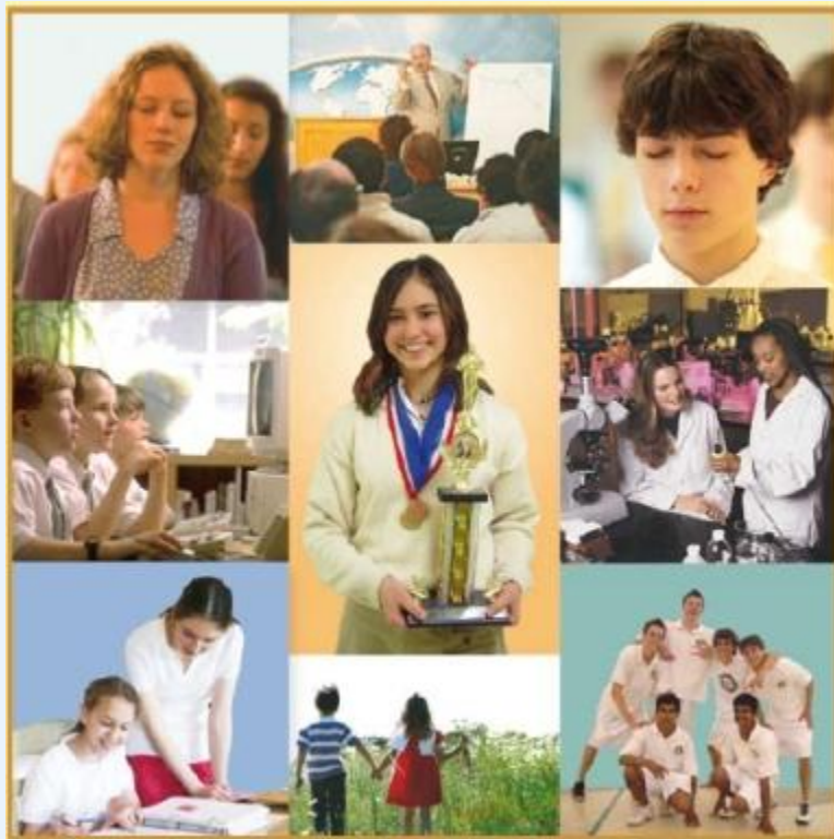
Pildid TM-i koolist, Fairfield Iowa

USA-s Iowas on kool, mis rakendab teadvuse arengul põhinevat haridust, tegutsenud 20 aastat ("Maharishi School, Fairfield, Iowa"). Kooli tulemused on erakordsed. Näiteks: